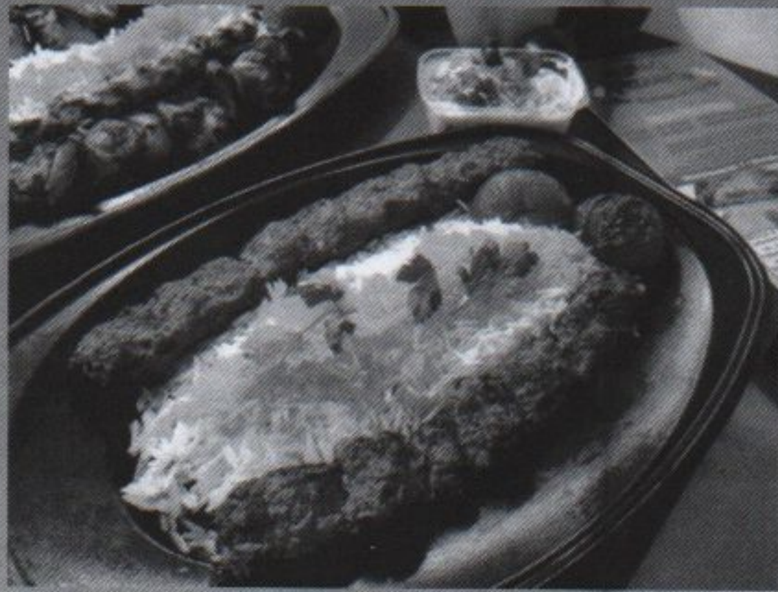
552 KALB/LAMM KEBAB KUBIDEH (gewolft)