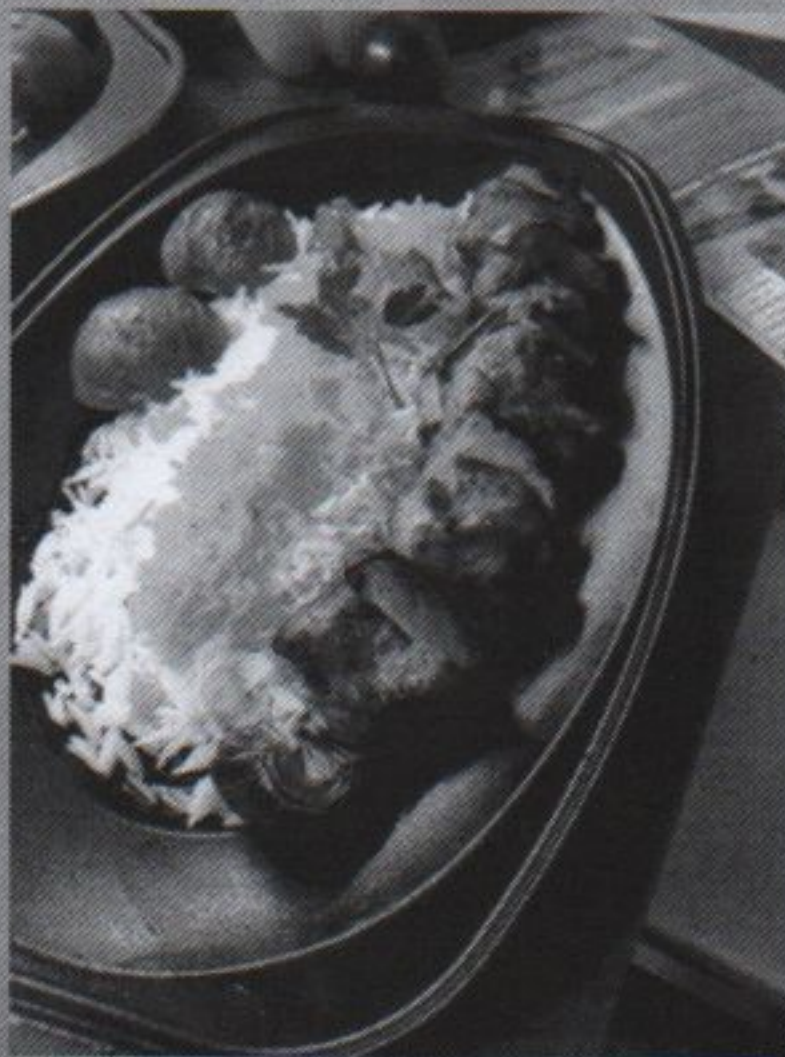
550 SCHWEINE SCHASCHLIK