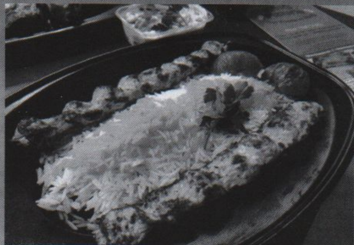
553 HÄHNCHEN KUBIDEH (gewolft)