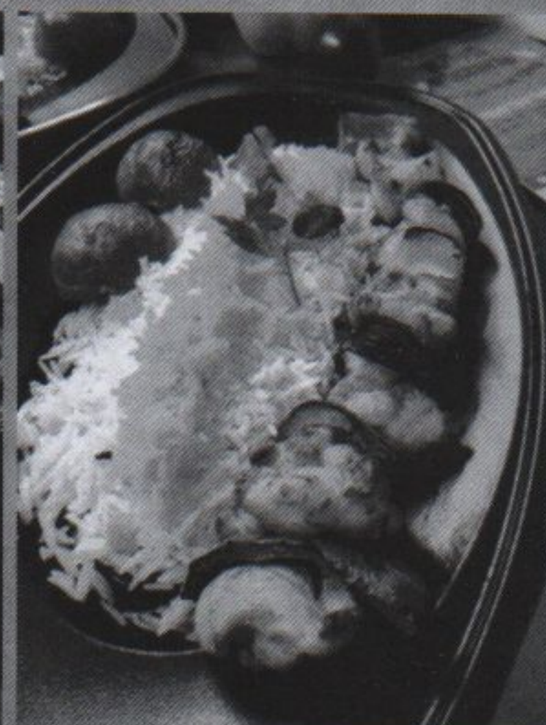
551 HÄHNCHEN SCHASCHLIK