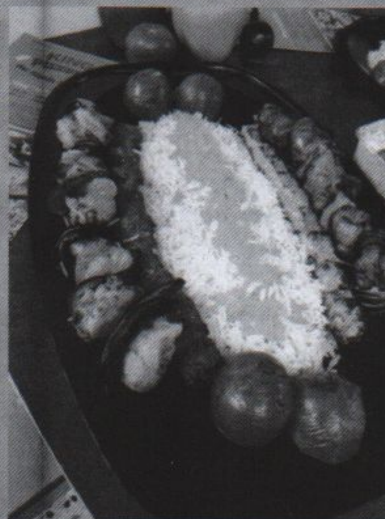
554 KEBAB SULTANI GRILL PLATTE